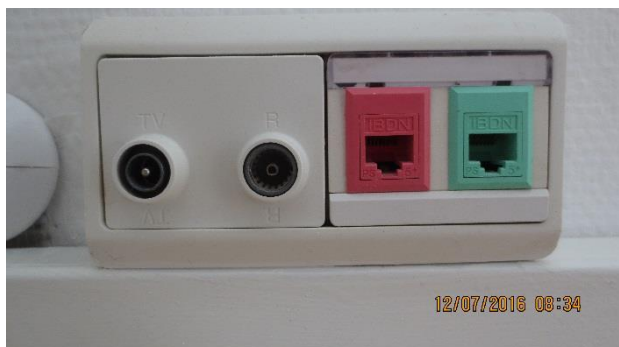
Bolignet stik til internet og telefon

Du finder bolignet-stik til internet og telefon i din bolig. Grøn port er internet og rød port er telefoni.